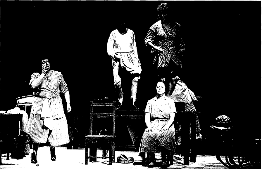
Danza de verano. (Argentina).