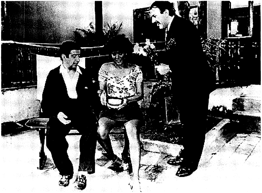
La siempre viva. (Colombia).