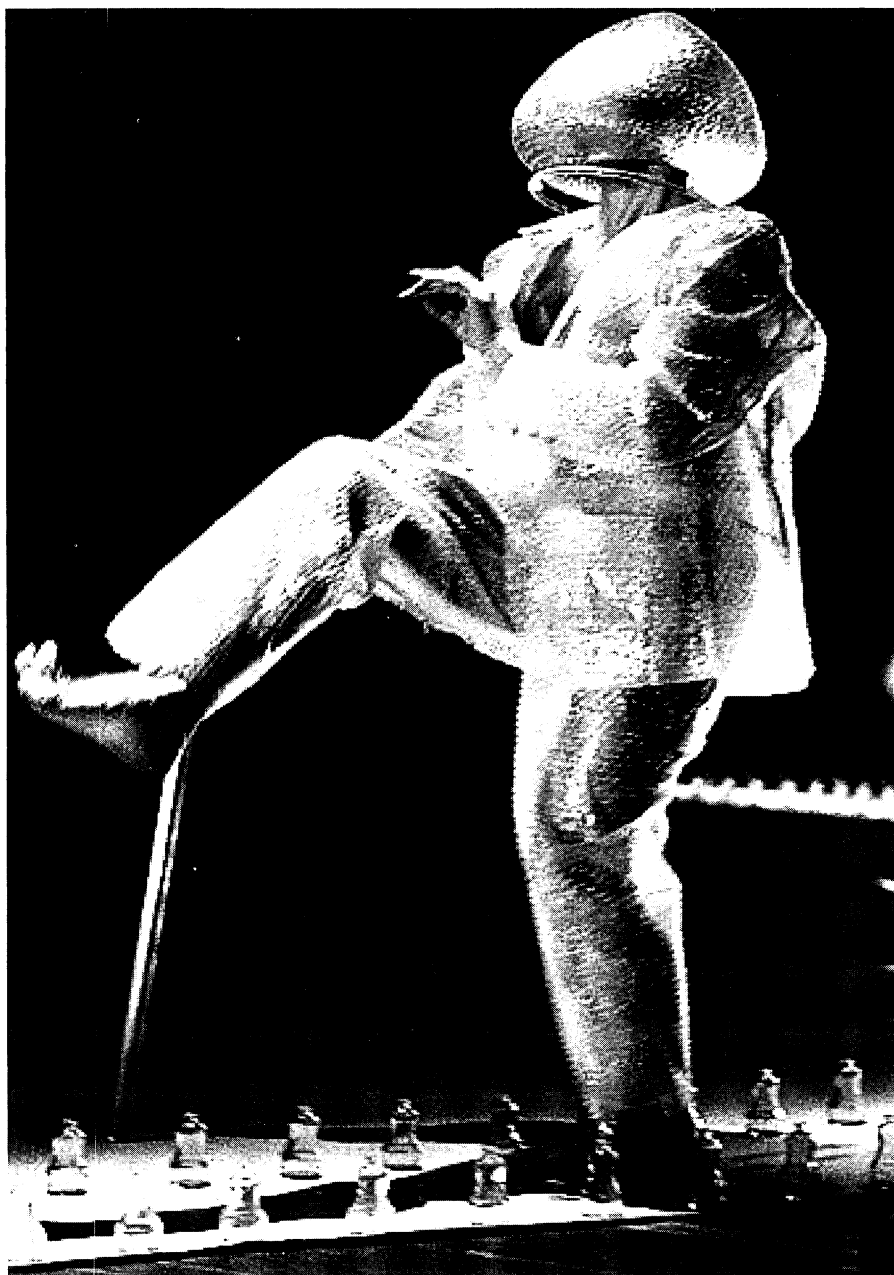
País de los ciegos. (Colombia).