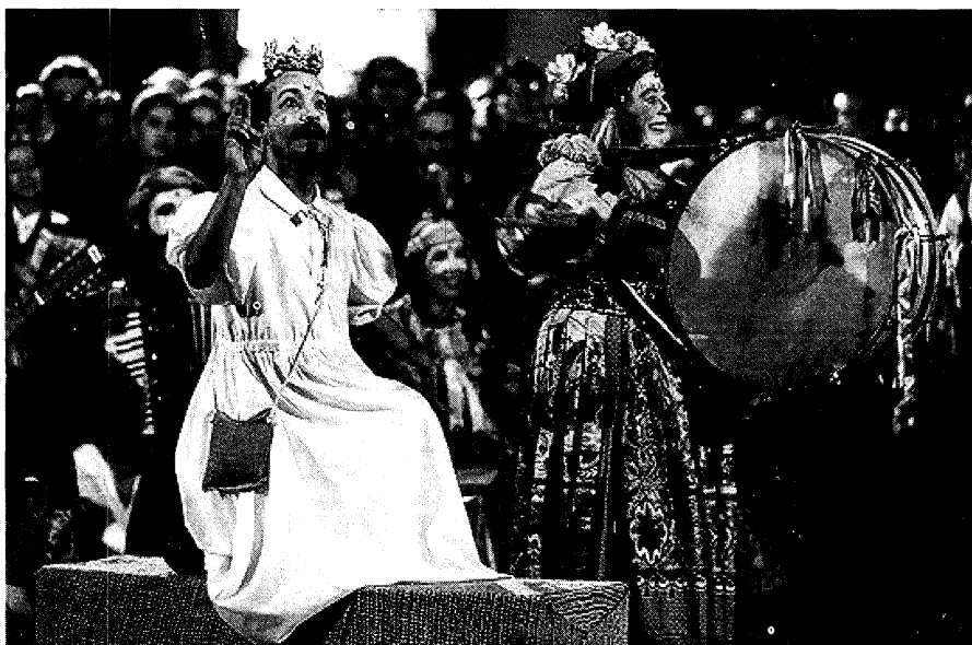
La Calle de la Amargura. (Brazil).