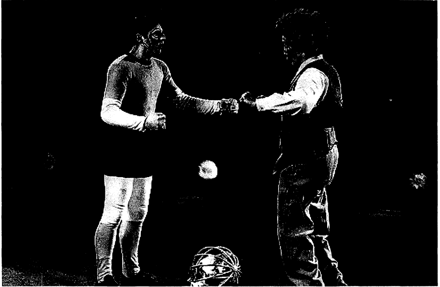
Taca-taca mon amour. (Chile).