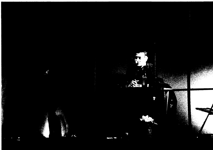
Chile: KM 69 Teatro. Are You Lonesome Tonight?