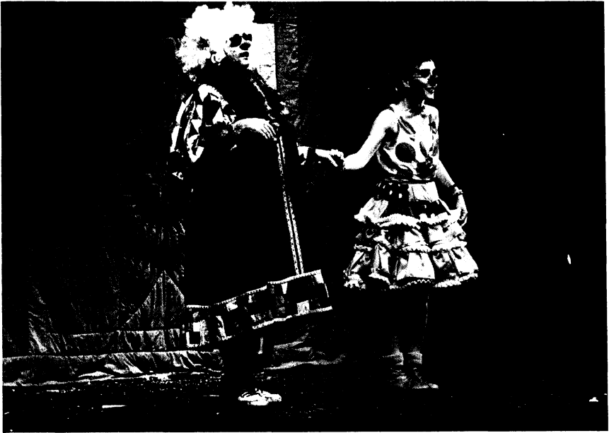
España: Laví e Bel. A moco tendido.