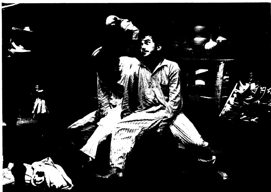
Brasil: Teatro Piollin. Vau da Sarapalha .