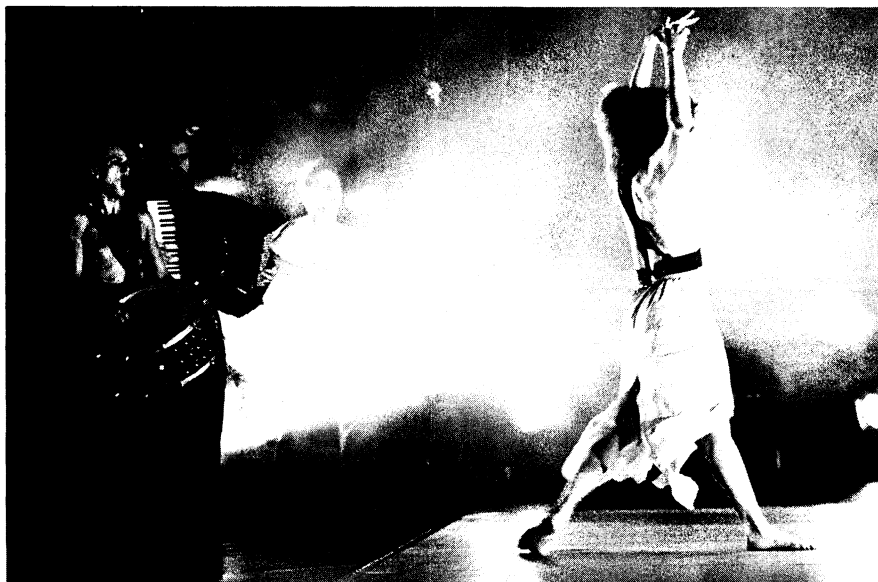
BRASIL: República da Dança: Forró for all , coreografia de Ana Mondini