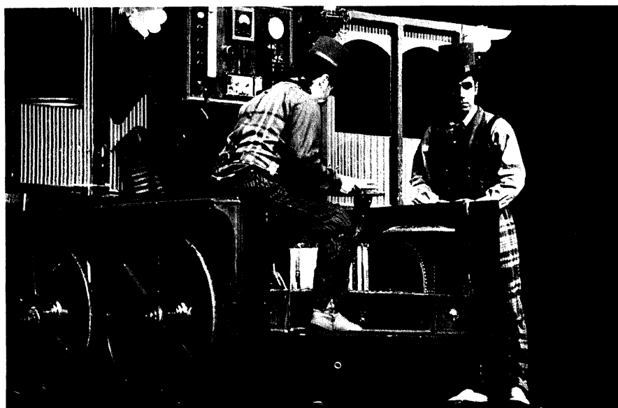
CHILE: Teatro La Troppa: Viaje al centro de la tierra , adaptación de la novela de Julio Verne