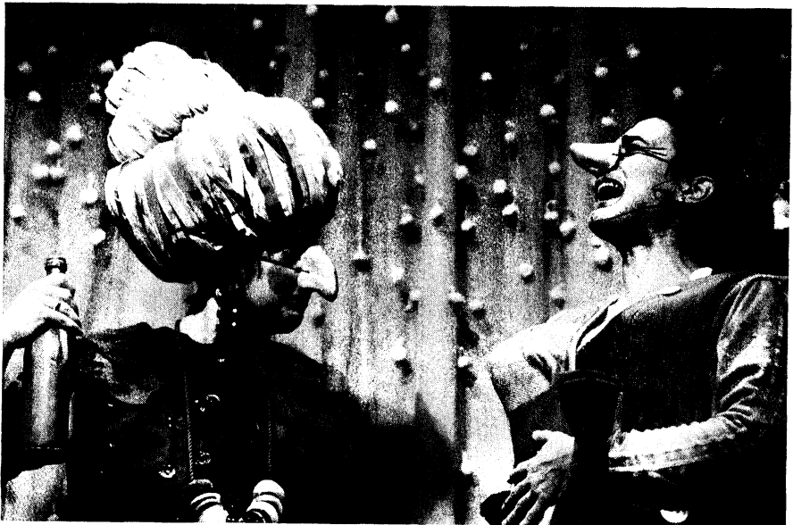
ESPAÑA: La Jácara: El retabllillo de don Cristóbal , de Federico García Lorca