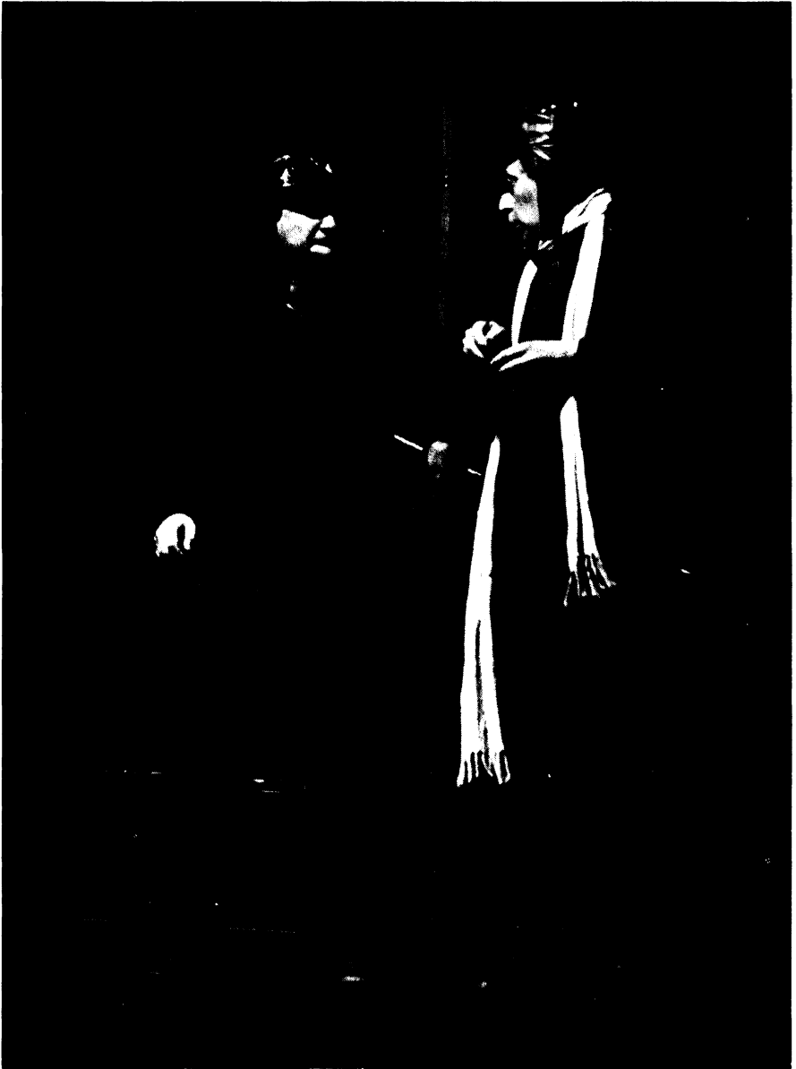
ARGENTINA: Equipo Teatro Llanura: Actores de provincia , de Jorge Ricci