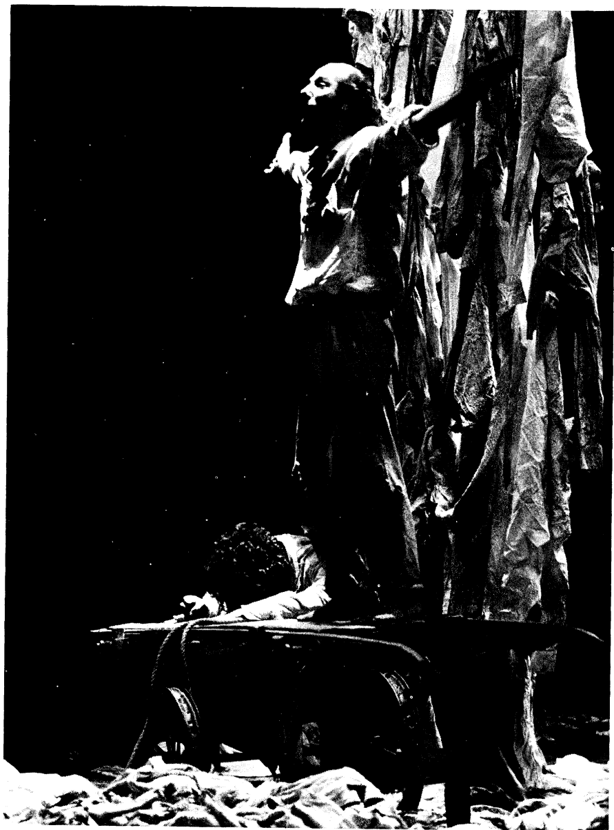
ESPAÑA: La Zaranda: Obra póstuma , de Eusebio Calonge