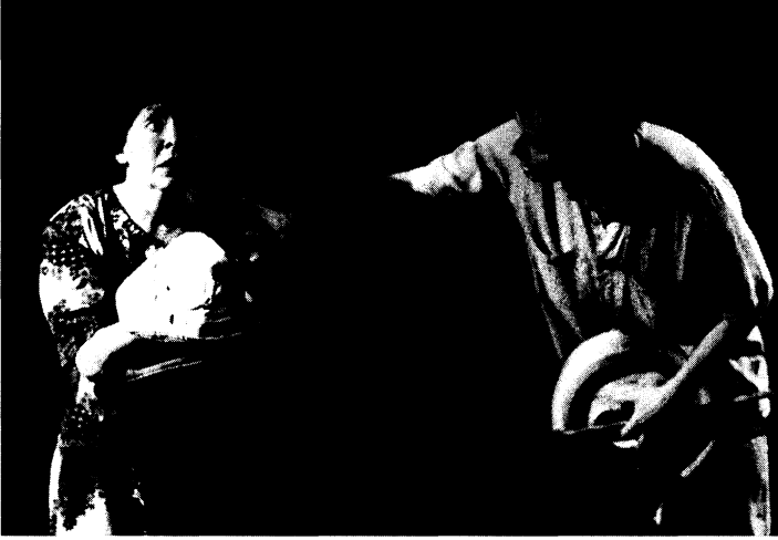
Gallina y el otro