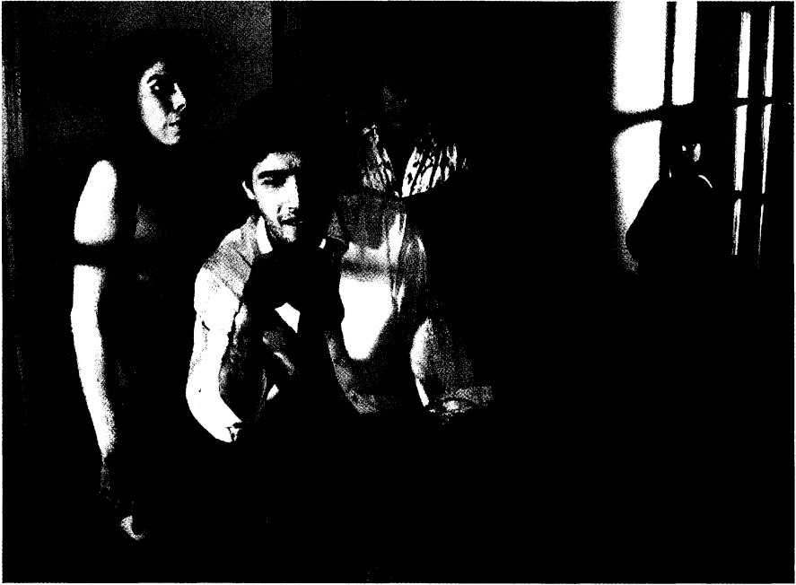
Bar de La iguana

el drama de un matrimonio en el cual el marido ha perdido la memoria debido a un trágico accidente de motocicleta. La esposa, tratando que él recupere sus recuerdos, recurre constantemente a unas antiguas fotos en blanco y negro que tienen que ver con sus historias. La obra sufre un cambio de expectativa violento con la aparición de su mejor amigo, que envuelve a la esposa, aprovechándose de la situación, trama una estrategia de seducción. Todo en ella transcurre dentro de una atmósfera aparentemente tranquila pero con una gran carga de drama. Lo más importante de la misma está en “lo que no se dice.” Piñáñez, su director y autor, logra desarrollar un tema truculento contrarrestando el mismo con elementos de gran carga poética.