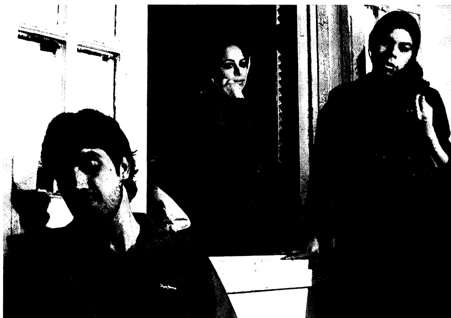
Ventana de Pasión cercana

Sin besos es el nombre de la primera obra. Juega con un tiempo y lugar que oscila entre el mundo real y el teatral. Con sencillos recursos se logra efectos pirandellianos que dan como resultado un juego dramático desconcertante. El texto teatral de El jorobado de Notre Dame sirve de pretexto para mostrarnos el intento de relación fracasada entre una actriz y su director. La obra, sin dejar en ningún momento de ser intimista, se inicia con un ensayo realizado entre el director, que en ese momento es actor, y su alumna. De golpe, termina el ensayo, se prenden las luces y continúa “la otra