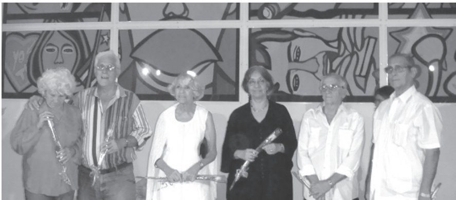
Primera generación de directores y dramaturgos del grupo Teatro Escambray.