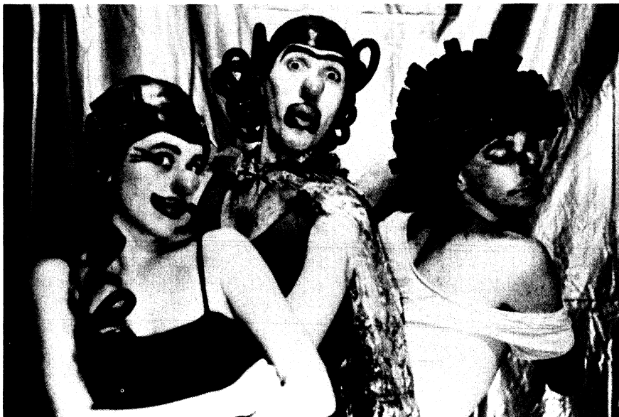
Grupo X.P.T.O. de Brasil. I Festival Iberoamericano de Teatro de Cádiz.