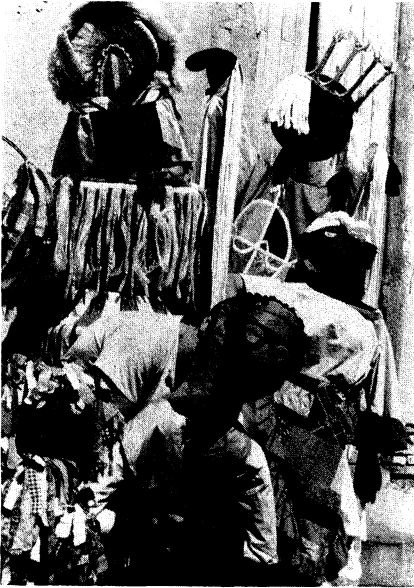
Nokán y el maíz de Cuba. I Festival Iberoamericano de Teatro de Cádiz.