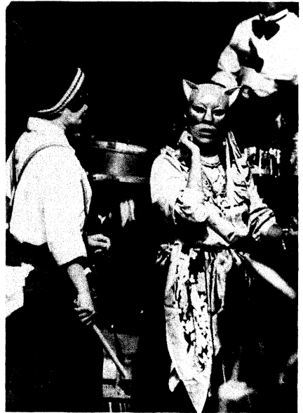
Los músicos ambulantes del grupo Yuyachkani. I Festival Iberoamericano de Teatro de Cádiz.

iberoamericano, como el dramaturgo español exiliado en Venezuela José Antonio Rial o el crítico José Monleón y tres organizadores de Festivales de teatro: Octavio Arbeláez, del Festival de Manizales en Colombia, María Helene Falcón, del Festival de las Américas de Montreal, y Lucy Neal, directora del London International Festival Theatre. En una entrevista publicada en el Diario de Cádiz (26-X-86, p. 8) estos tres últimos alabaron el Festival de Cádiz refiriéndose a él como una muestra de teatro iberoamericano que facilitará la entrada del mismo en el resto de Europa. Finalmente, sólo me queda mencionar que Cádiz ha sido elegida sede de la III Conferencia Iberoamericana de Teatro, que se celebrará en esta ciudad una semana antes o después del II Festival Iberoamericano de Teatro en 1987.