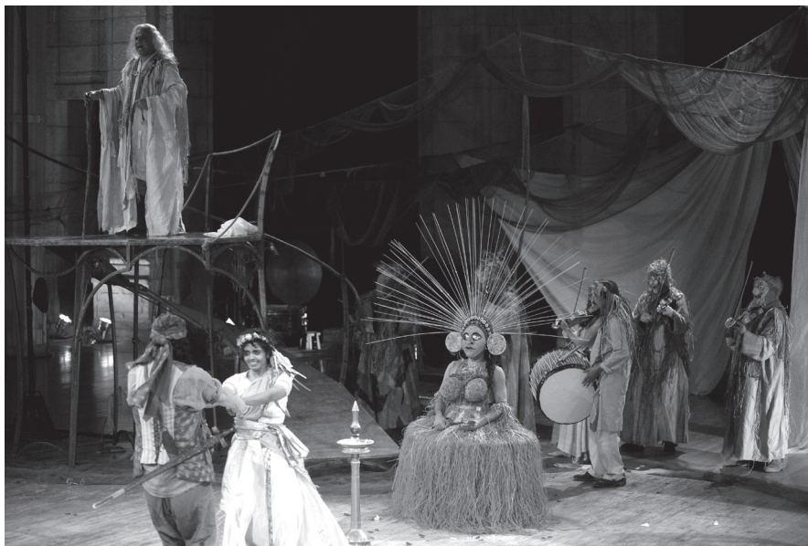
The Indian Tempest , Footbarn Traveling Theatre.

de participación de Matosinhos, que en años anteriores, había ofrecido sus espacios y recursos y que, esta vez, por la crisis reinante, se abstuvo de participar. Dentro del contexto de las celebraciones de la ciudad, hubo otro espectáculo relacionado con Guimarães, al que nos referiremos a continuación.