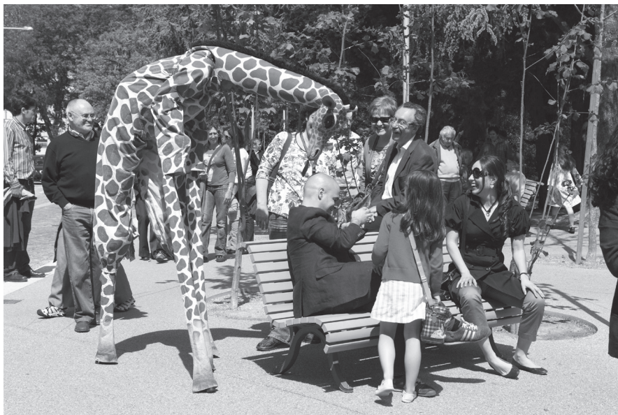
Girafes , Xirriquiteula Teatre.

trar al teatro. Lo que sucede afuera y adentro es muy diferente. El recorrido por las calles, dirigido por “La Loira”, tiene un ambiente festivo. El público encuentra pancartas o letreros pegados en paredes, en autos estacionados y en otros lugares, con textos breves o simples rótulos de Heiner Müller. La atmósfera lúdica creada por los actores y el rápido recorrido impidieron una lectura más a fondo de los textos, pero creemos que esa es la intención del grupo. Aunque el teatro de calle puede tener una estructura previamente diseñada, siempre está sujeto a improvisaciones y situaciones creadas por el volátil contexto en que sucede. En el caso de Quem não sabe mais quem é , un policía, que creíamos formaba parte del elenco, reaccionó airadamente contra los actores que, según él, estaban infringiendo las leyes del tránsito. Fue un momento de tensión que los artistas sortearon muy bien. Nadie fue preso y “La Loira” pudo continuar su recorrido. El ambiente de diversión que reinó en la calle desapareció al entrar en la sala, donde el espectador se encontró con un escenario de recargada escenografía: un departamento con muebles y objetos, los más disímiles, donde los personajes actuaban de manera violenta, provocando esa tensión típica de las piezas de Müller que, en este caso, hizo que el espectador permaneciera crispado al ser expuesto a situaciones dramáticas en torno al abuso de poder.