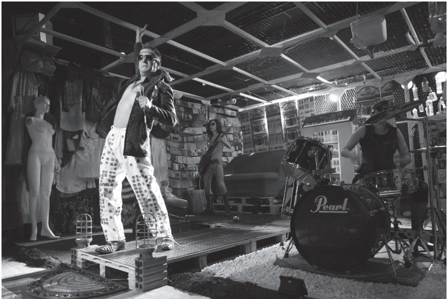
Quem não sabe mais quem é, o que é e onde está, precisa se mexer , São Jorge de Variedades.

Otro espectáculo presentado en el contexto de las actividades especiales de Guimarães fue The Indian Tempest (Tempestad Indiana) , una original adaptación del texto de Shakespeare. La escenificación fue preparada por el grupo Footbarn Traveling Theatre durante sus tres meses de residencia artística en Guimarães. En un parque de la ciudad, el grupo armó una carpa donde además de preparar el montaje de Indian Tempest desarrolló actividades orientadas a la comunidad. La puesta se realizó en el Mosteiro de São Bento da Vitória vinculado al Teatro Nacional de São João. The Indian Tempest es un espectáculo ecléctico que combina diversos códigos artísticos, culturales y teatrales. El texto del dramaturgo isabelino es enunciado en diferentes lenguas lo que habría resultado una desventaja si no hubiera sido por la abundancia de recursos escénicos compensatorios: música, canto y una variedad de imágenes visuales que se imponían a la palabra. El multilingüismo y diversidad de estilos, sin embargo, no distanciaron al espectador, impresionado por el virtuosismo de los actores, por el uso de máscaras, su vistoso vestuario y, sobre todo, por la música que era interpretada con instrumentos autóctonos de la India.