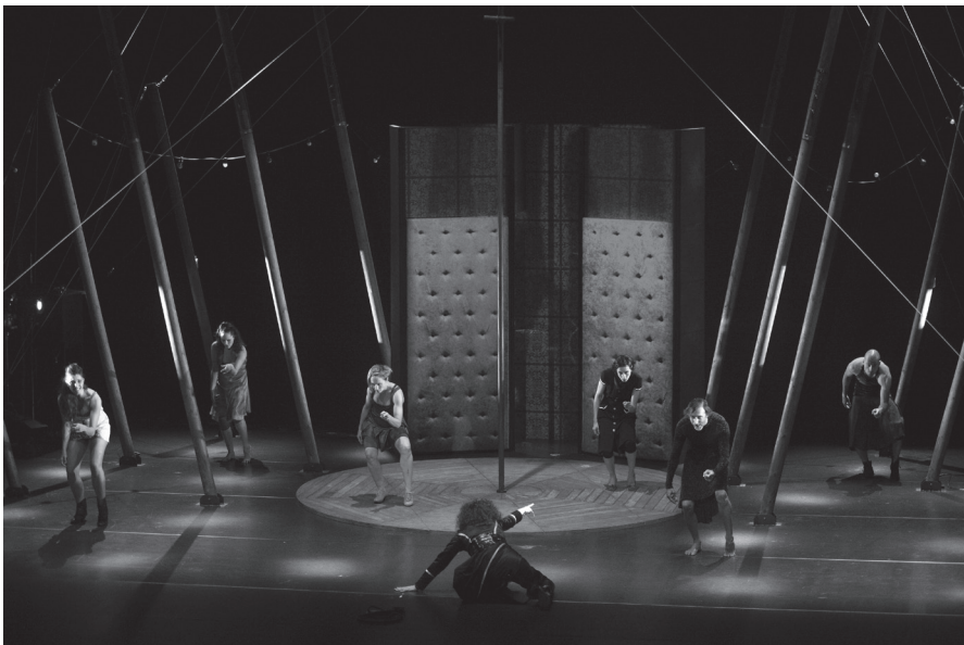
Petra, la mujer araña y el putón de la abeja Maya , Sol Picó de España.