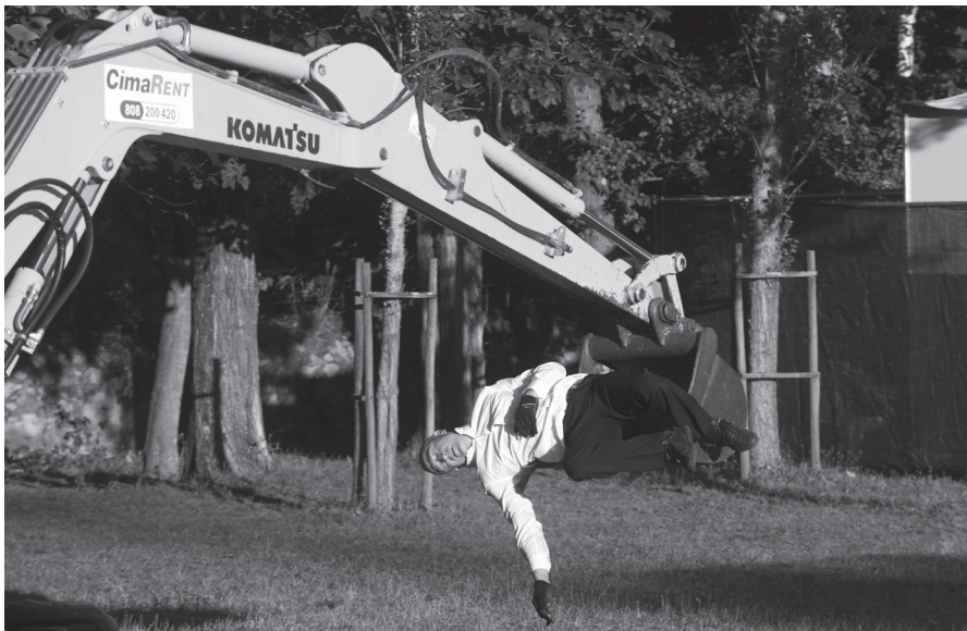
Transports exceptionels , Beau Geste.

Otro espectáculo que merece un párrafo aparte es Transports exceptionels del grupo francés Beau Geste, presentado en el Parque Serralves