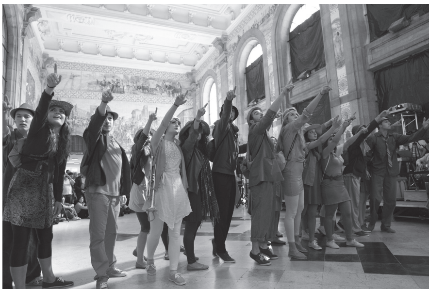
Sinfonía Erasmus , los estudiantes del programa Erasmus.

La estación de ferrocarril São Bento, con su imponente arquitectura y magníficos murales de azulejo que narran la historia y cultura portuguesa, fue el espacio ideal para realizar Sinfonía Erasmus , un proyecto concebido por Mário Moutinho. En él, un energético y entusiasta grupo de estudiantes de toda Europa, integrantes del programa Erasmus, contaron sus vivencias y experiencias en Oporto. Con cantos, danza y música, relataron de manera divertida los ajustes culturales que debieron realizar en un mundo que no les era familiar. Los estudiantes crearon sus propios instrumentos, preferentemente de percusión, que dieron un brillo especial a la coreografía de