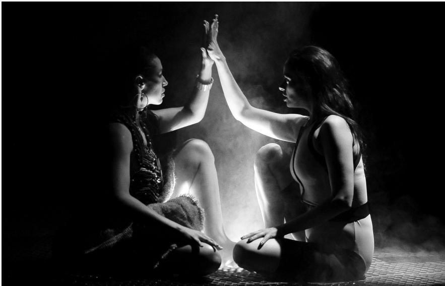
Obra: AguaSangre .

Es este deseo de reafirmar que todo está conectado. Si bien Tláloc es de la cultura olmeca o la náhuatl, del centro, y los cenotes mayas son del sur/sureste, quise escoger a Chalchiutlicue como la representante de las diosas del agua, porque parecía la más poderosa. Aunque estemos divididos geográficamente, la cultura prehispánica es una; cada día se descubren más interrelaciones entre las diversas culturas. Me encantaba la idea de los cenotes y los sacrificios humanos, porque eso me daba la otra asociación. Nuestra sociedad está basada en los sacrificios humanos de mujeres. En los cenotes sagrados a las mujeres se les echaba para ofrecerlas al dios que trajera la lluvia, las buenas cosechas, etc. Pues aquí se sigue sacrificando a las mujeres, no para que traigan ningún bien sino una satisfacción personal, otros intereses.