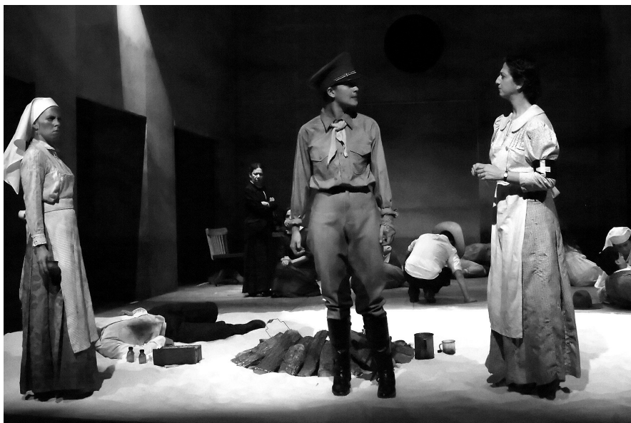
Obra: Soles en la sombra .

época con diferentes búsquedas escénicas. Y Soles en la sombra , que es una obra histórica y muy social, la que para mi sorpresa tuvo mucho éxito. Desde el día del estreno se agotaron los boletos. En ese sentido fue significativa.