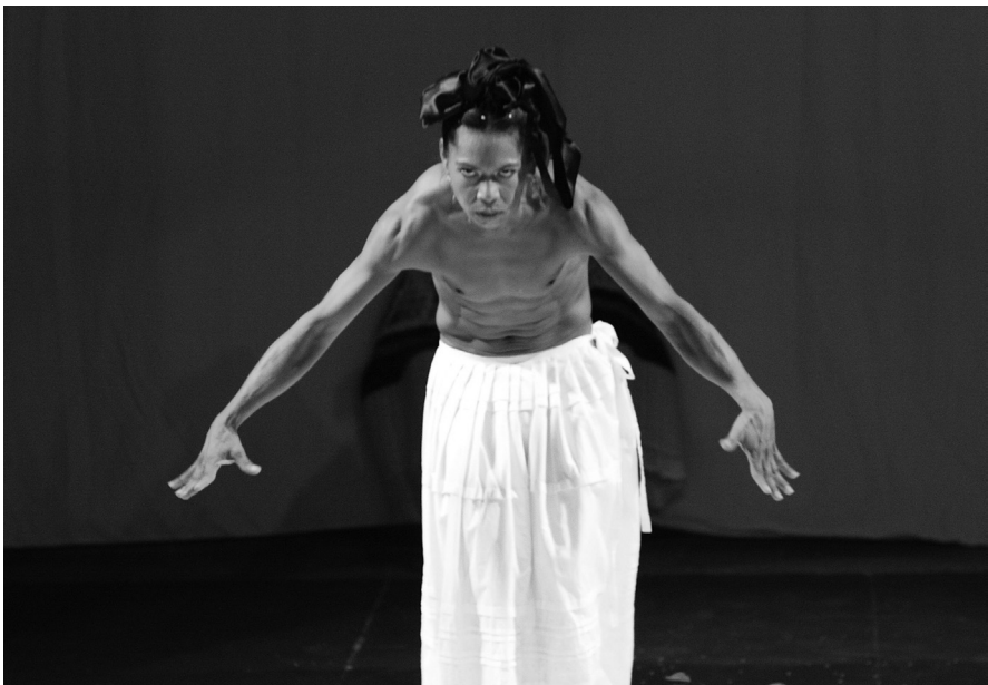
“Danza del alcaraván”.

Sigue la escena del luto en la que Avendaño representa a la “rezandera”, de falda negra sobre enagua blanca y un rebozo negro que le cubre