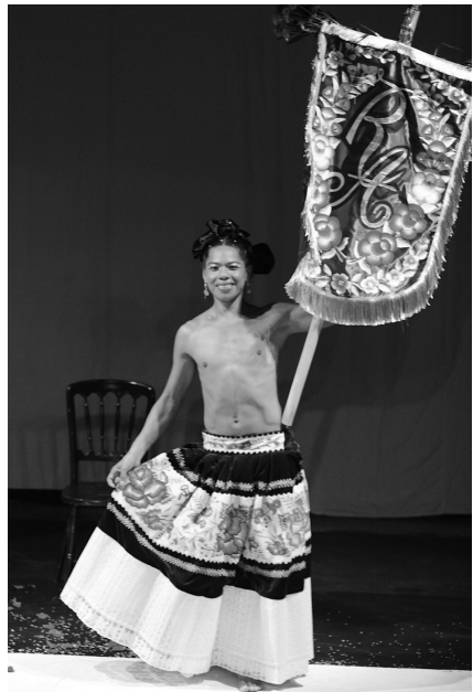
“Fandango tehuano” con estandarte.

Esta es una danza tradicional entre los zapotecas de Tehuantepec y San Blas Atempa, una danza que representa el apareamiento del ave conocido localmente como berelele, alcaraván en castellano o Burhinus oedicnemus , su nombre científico. La danza tradicionalmente se baila por un hombre y una mujer, en esta modalidad sólo es presentado por el Muuxhe , quien en su imagen femenina no podría presentar la danza de la manera tradicional y para esta ocasión la ejecuta solo pero imaginando siempre a su pareja con quien se aparea aunque para la vista de los