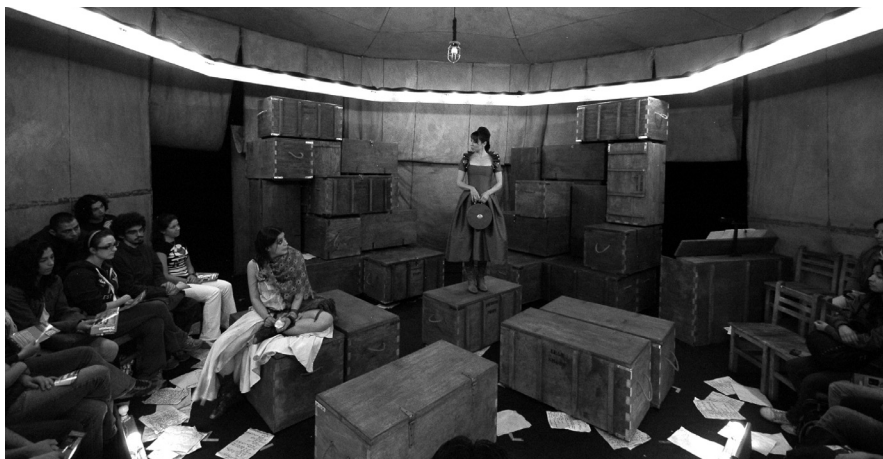
Las relaciones (sexuales) de Shakespeare (y Marlowe).

día tuve la claridad de lo que era la historia, me obsesioné con la amante de él. A partir de ahí surgió esta historia en la cual todo le ocurre a la amante que llega ese día y camina por las calles de Londres.