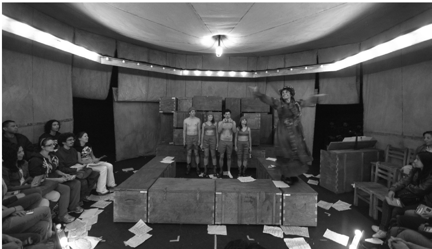
Las relaciones (sexuales) de Shakespeare (y Marlowe).