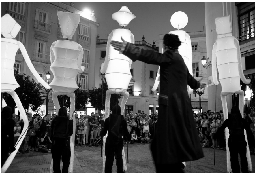
Big Dancers, El Carromato.

magníficos guitarristas y cantaores pusieron el broche final a esta excelente propuesta que el público del Falla premió con un largo aplauso.