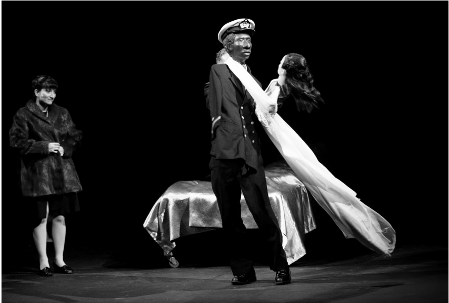
Otelo , Viajeinmóvil. Foto: Kikifotógrafo

particular interpretación de Romeo y Julieta aunque un tanto alejada de la versión original de Shakespeare.