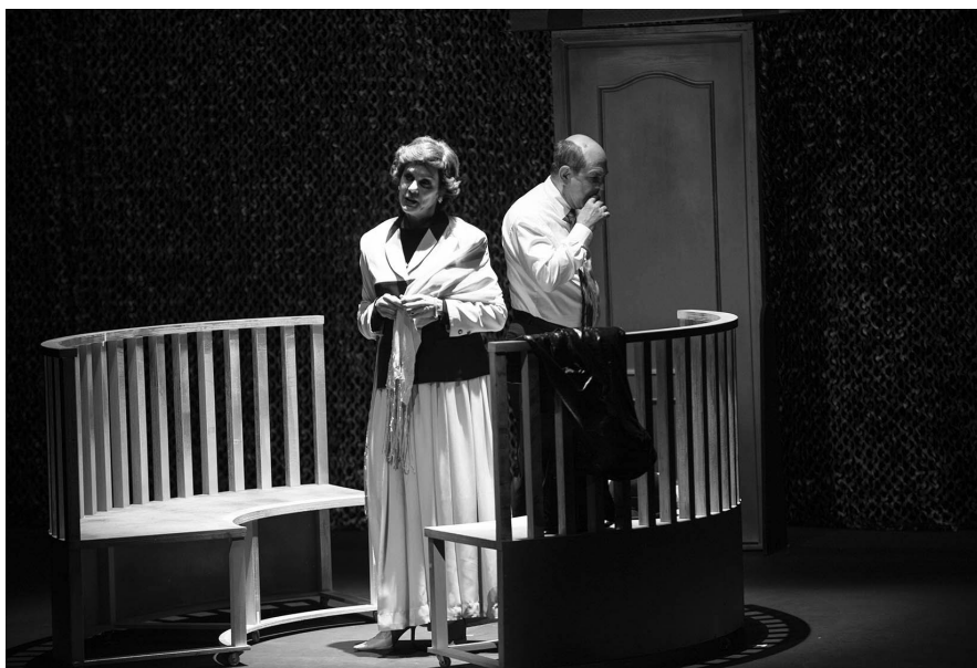
Al pie del Támesis , Teatro Avante. Foto: Kikifotógrafo

Teatro del Azoro (El Salvador) puso en escena Los más solos de Egly Larreynaga y Luis Felpeto. La acción tiene lugar en el pabellón psiquiátrico del penal de Soyapango, en San Salvador. Según contaron en uno de los foros,