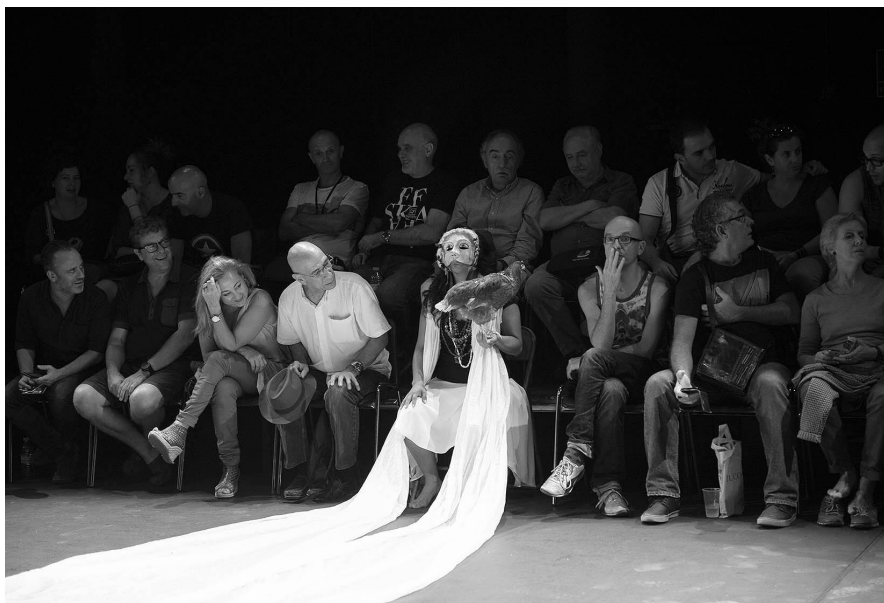
Mendoza, Los Colochos Teatro.