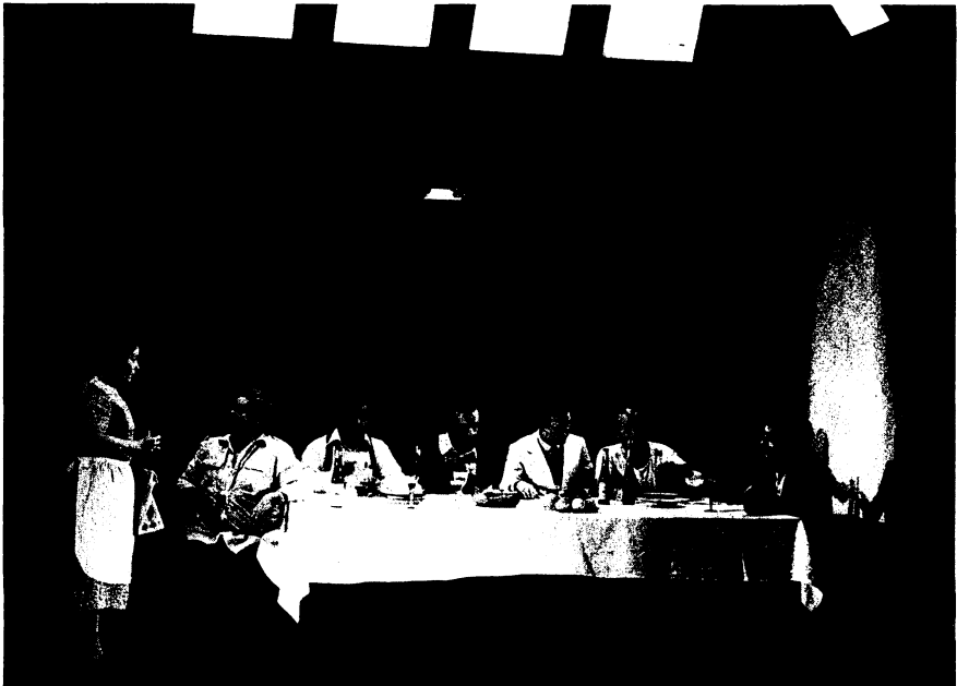
Mesopotamia de Isaac Chocrón, dirigida por Ugo Ulive, 1980.