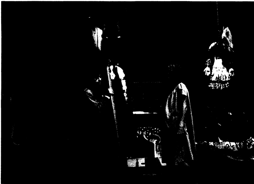
Los ángeles terribles , escrita y dirigida por Román Chalbaud, 1967.