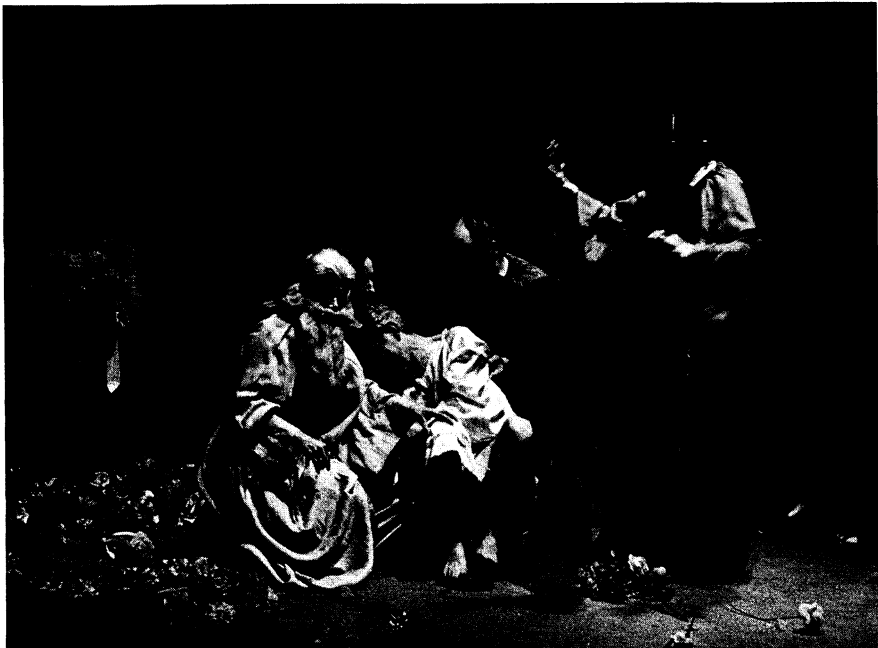
Profundo , escrita y dirigida por José Ignacio Cabrujas, 1971. Courtesy: Miguel Gracia.