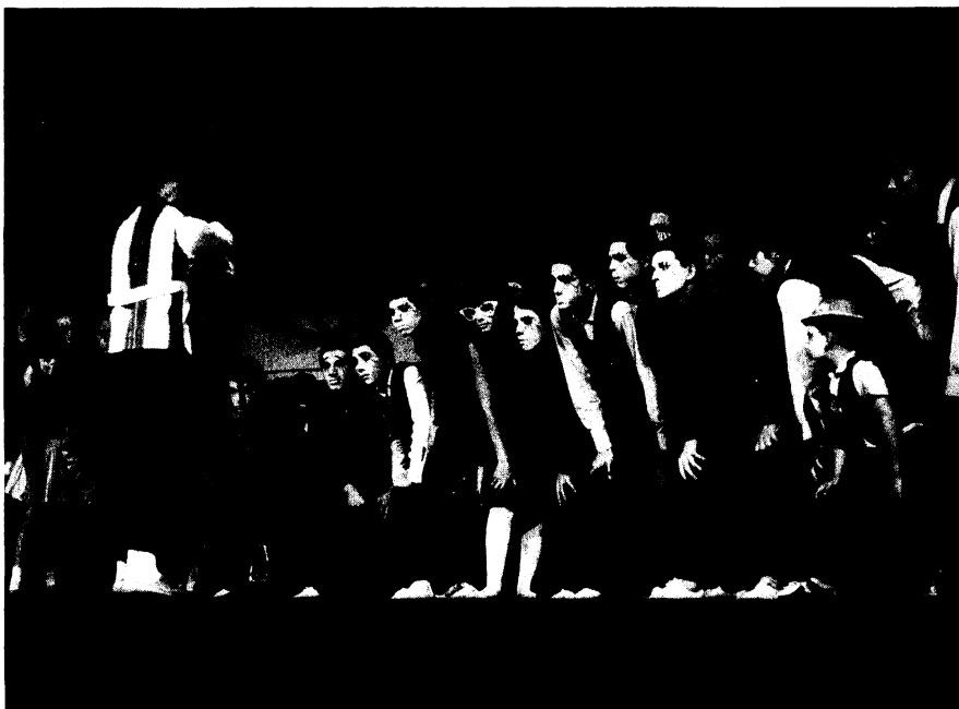
Vimazoluleka , escrita y dirigida por Levy Rossell, 1966.