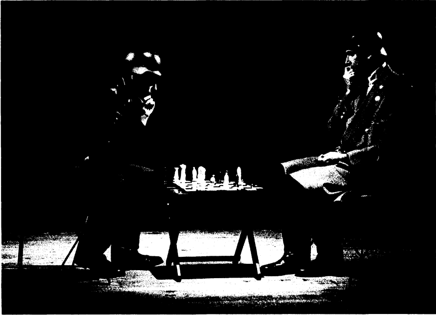
Jav y Jos de José Simón Escalona, dirigida por Javier Vidal, 1986.